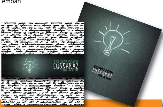
Libro de ayuda para crear diferentes documentos (en euskera y castellano) Podrás conseguirlo en el Ayuntamiento.

Udaleko web orrialdean deskargatu ahal izango duzu liburuen eredu bat PDF-an. http://www.lemoa.net/eu-ES/Orrialdeak/default.aspx